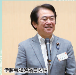
伊藤衆議院議員挨拶