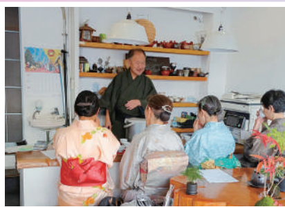
「着物で楽しむ自分時間・お茶の淹れ方講座」 西野園・リユース着物 小春家