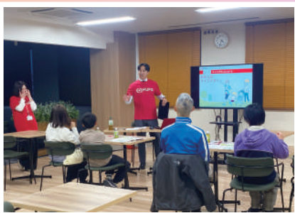
「はじめてのマネー教室 親子で学ぶお金の基本」 株式会社 三菱UFJ銀行 三鷹支店