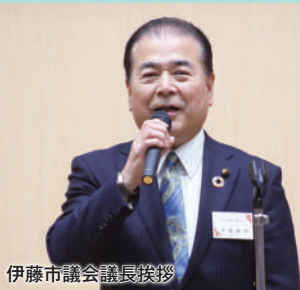
伊藤市議会議長挨拶