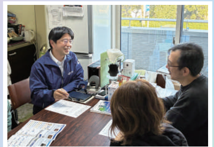
「商店街の中心で仕事とまちづくりを考える」 ベスト電器 連雀店