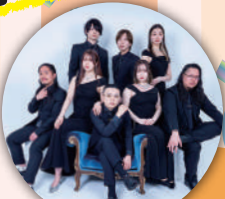
特別ゲスト URUHAMO 6日(土)来場予定