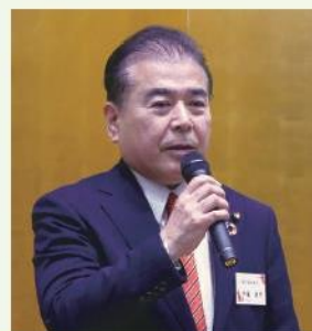
伊藤三鷹市議会議長