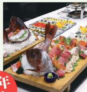
飲食をともなう開催となりました