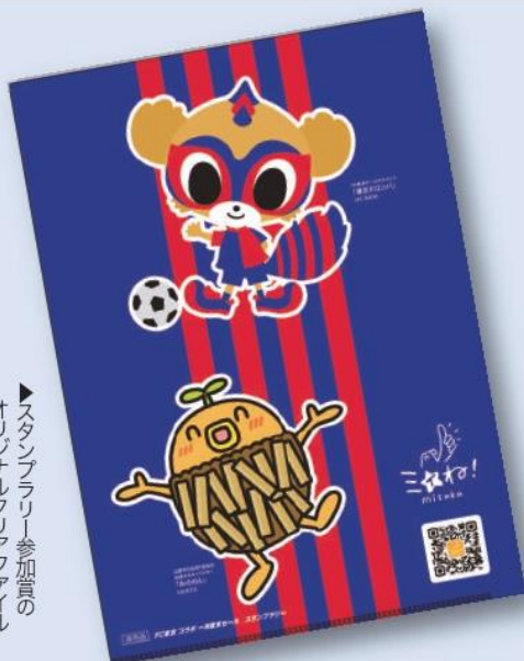
▶スタンプラリー参加賞のオリジナルクリアファイル

期間中、三鷹市内を中心としたイベント参加店に行き、アプリ「ミネ! mitaka」でスタンプを集めて応募していただくと、FC東京のオリジナルグッズや豪華家電などの景品が抽選で当たるイベントです。セール参加店54店舗でスタンプラリーが行われ、抽選には多くの方にご応募いただきました。イベントにご参加いただいた皆様、誠にありがとうございました。