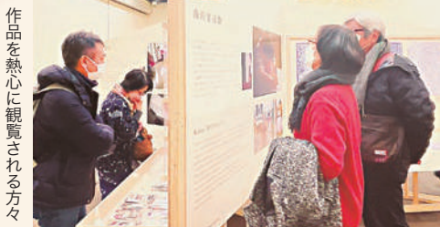
作品を熱心に観覧される方々