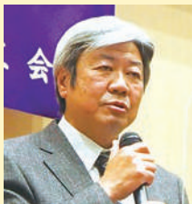
塩原建設業部会長