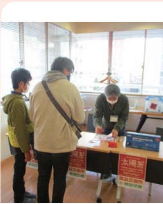
過去の景品交換の様子

みたか太陽系ウォーク・スタンプラリーは、三鷹市内を13億分の1に縮小した太陽系に見立て、店舗や観光スポットに行きスタンプを集めることで「まち歩き」を楽しみながら太陽系の大きさや距離を実感するスタンプラリーです。 今年度は、アプリ「ミィね!mitaka」を活用し、非接触のデジタルスタンプラリーとして昨年度よりも規模を拡大して開催します。参加者は、三鷹市全域(11の天体エリア)の店舗や観光スポットを巡り、GPS機能等により「惑星スタンプ」を集めます。三鷹商工会ではこれに合わせ、「ミィね!mitaka」のアプリをダウンロードし応募された方に抽選で「移動式プラネタリウム」への参加チケットのプレゼントを企画(ダウンロードの方も応募可能)。参加者の間口を広げ、市内の商店振興を図ります。