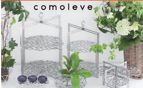
comoleve: 日本らしい情緒的な言葉[木漏れ日]とフランス語の「上げる」を意味する[lever]からcomoleveと名付けた。

三鷹市下連雀8-9-20 TEL:0422-70-6388 設立:1998(平成10)年 事業内容:金属レーザ加工、ステンレス製テーブルウェアの製造・販売