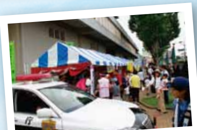
第一庁舎前の警察署展示