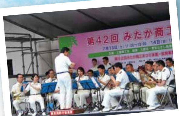
東京消防庁音楽隊