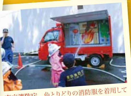
東京消防庁 色とりどりの消防服を着用して 消火体験もできます