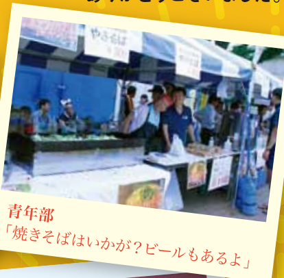
青年部 「焼きそばはいかが？ビールもあるよ」