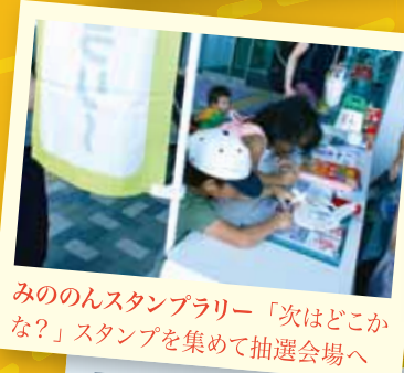
みののんスタンプラリー「次はどこかな？」スタンプを集めて抽選会場へ