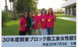
30年度関東ブロック商工会女性部交流研修会 平成30年7月3日 大磯