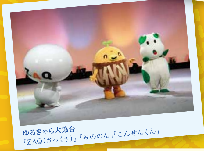
ゆるきゃら大集合 「ZAQ(ざつう)」「みののん」「こんせんくん」