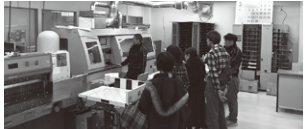
2月に開催された「まちゼミ」の様子