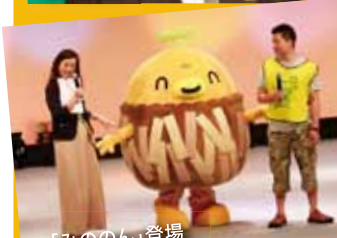
「みたかのもん」登場