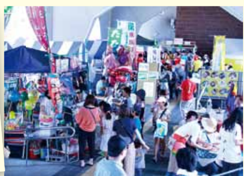
三鷹市役所入り口 ゲームコーナーや物販コーナーにもぎわっています