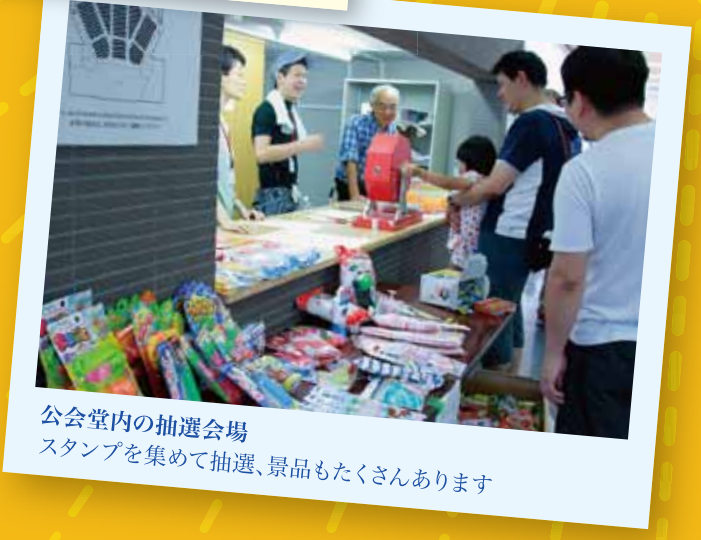
公会堂内の抽選会場 スタンプを集めて抽選、景品もたくさんあります