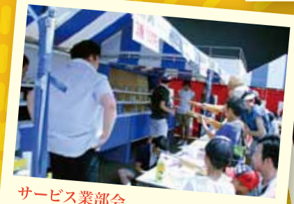
サービス業部会 大人も子どもも真剣に的を狙います