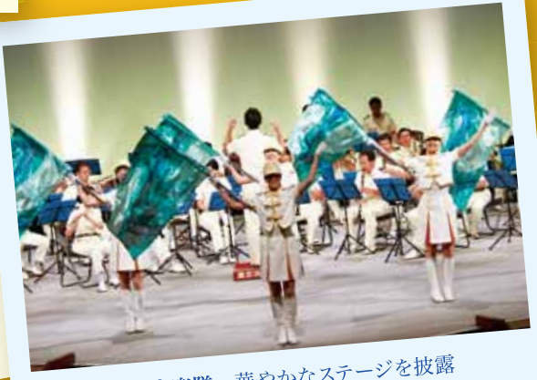
東京消防庁音楽隊 華やかなステージを披露