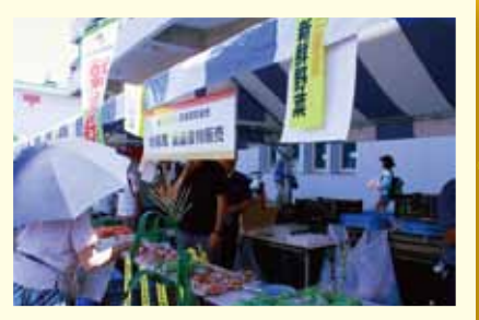
東京むさし農業協同組合 三鷹産のおいしい野菜を販売しています