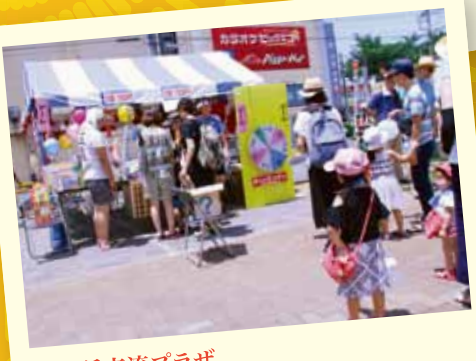
異業種交流プラザ 人気のダーツには子どもたちが並びます