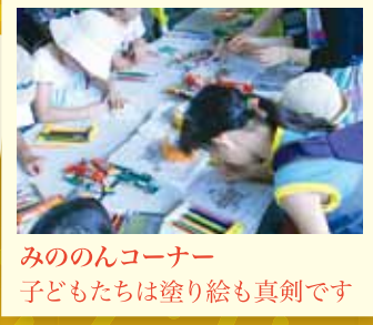
みののんコーナー 子どもたちは塗り絵も真剣です