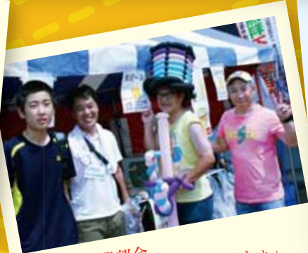
サービス業部会 「暑いときにはやっぱりビールでしょ」