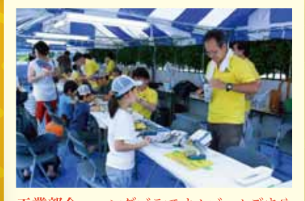
工業部会 ハンダゴテでオルゴールごまや ラジオを作る体験コーナー