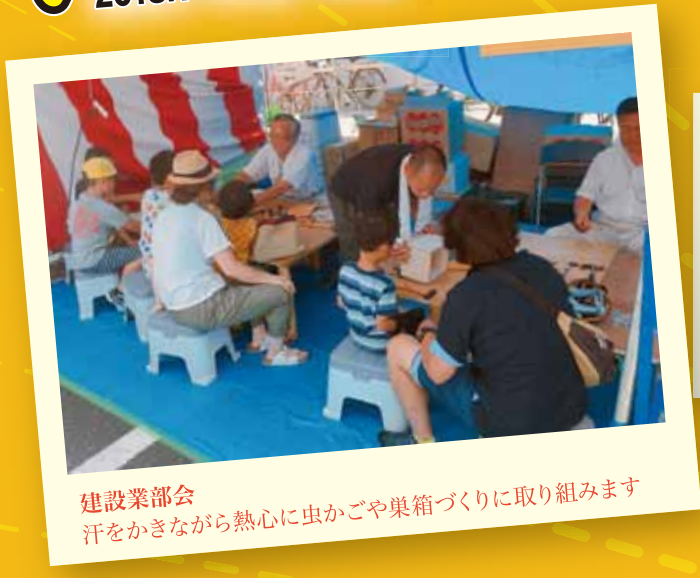
建設業部会 汗をかきながら熱心に虫かごや巣箱づくりに取り組みます