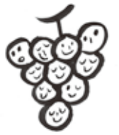
illustration: Sato Kumiko