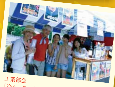
工業部会 「冷たい飲み物を、各種そろえました!」