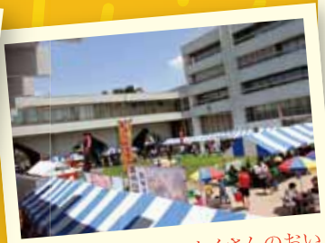
三鷹市役所中庭 たくさんのおいしい しそな屋台が並びます

「みたか商工まつり」にはたくさんの方にご来場いただき、 会場の様子をご紹介します。