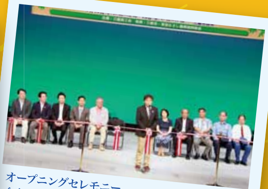
オープニングセレモニー 今年は光のホールで行われました