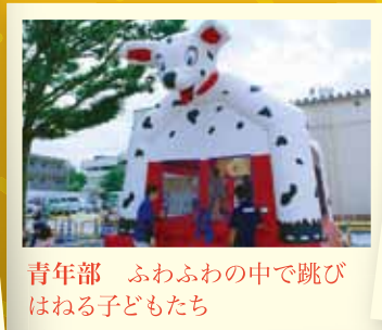
青年部 ふわふわの中で跳びはねる子どもたち