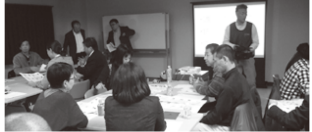
前回の「まちゼミ」講習会の様子

お店の人が講師となって、その専門店ならではの知識やコツ、業界秘話などをお客様にお伝えし交流を深めるミニ講座です。15年ほど前に愛知県岡崎市ではじまり、今では全国各地で開催されている「お店を繁盛させたい方の究極の販促イベント」といわれています。