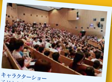
キャラクターショー 子どもたちの大歓声が響く満席の会場