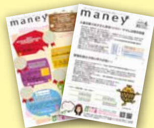
子育てに役立つお金の情報フリーペーパー「maney」