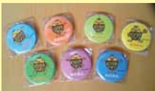
缶バッジは7種類あるよ!