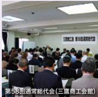
第58回通常総代会(三鷹商工会館)