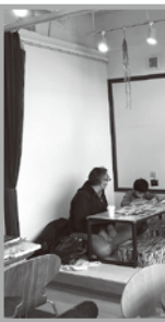
「好きを学ぶ！表現も楽しみながら」