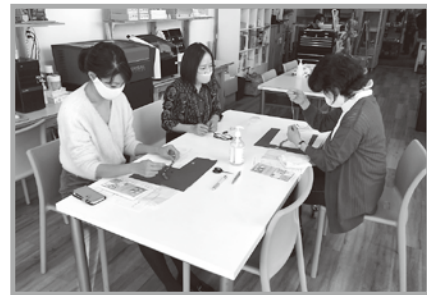
手づくり好きな方向けに定員2名で数回開催した「ゴムプレス」の作り方。

「第4回三鷹まちゼミ」は2020年11月1日から30日までの30日、大防止に十分配慮し、オンライン講座など61講座に約500名の参加がありました。