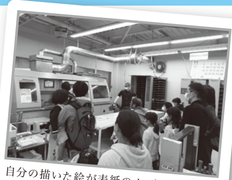
自分の描いた絵が表紙のノートになる工程(製本)に興味津々でした。

0日間、三鷹市内の各所で開催されました。新型コロナウイルス感染拡大の皆様にご参加いただきました。その様子を抜粋してご紹介します。