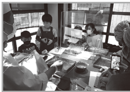
「親子で作ろう! そば巻きずし」はアクリル板を立てて実演しました。