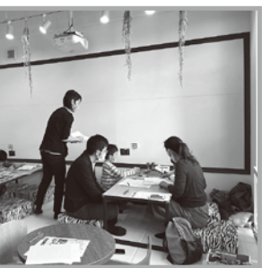
「表現教室」に就学前のお子さんら参加されました。