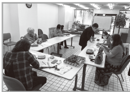
毎回申し込みが多数の、ネクタイを再利用した手作りネックレス講座。