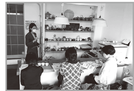
「管理栄養士とお茶屋の免疫力」と題したコロナ企画は2倍お得で人気です。