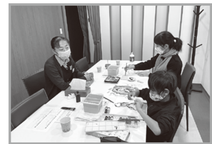
じっくりと仏画と向き合う静かな時間が流れていきます。