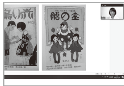
朗読家による童謡詩の朗読とテレビ局とのコラボによるオンライン講座は好評でした。