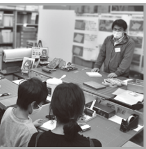
写真でオリジナルの「パネル作り」をした。