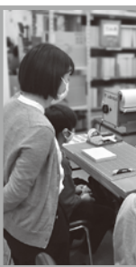
お気に入りの写真を体験しました。