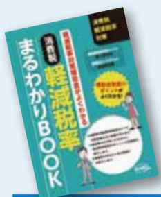
(中小企業庁発行『消費税軽減税率まるわかりBOOK 2017年3月発行』より抜粋)