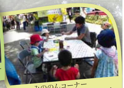
みののんコーナー 塗り絵コーナーも人気です