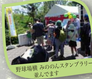
野球場横 みののんスタンプラリー 並んでいます

今年も女性部は水飲み場を担当。「いってらっしゃい」「頑張ってね!!」と声援とともに踊り手さん達へ冷たいお茶を配り、一緒にお祭りを盛り上げました。