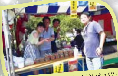
青年部「焼きそばにビールはいかが?」