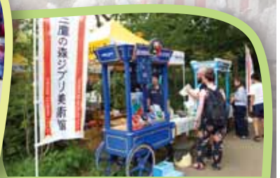
三鷹の森ジブリ美術館 屋台にも夢がいっぱい