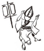
illustration: Sato Kumiko