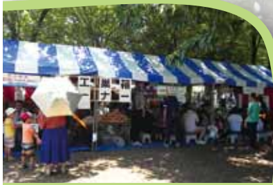
建設業部会 巣箱・虫かごづくりテント内はぎっしり