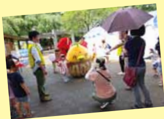
撮影にも順番待ちができる みののんです