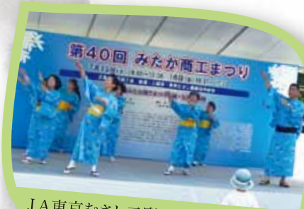
JA東京むさし三鷹地区女性部の皆さん