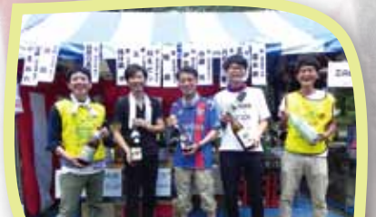
三の会「いろんな焼酎、ご用意してますよ」