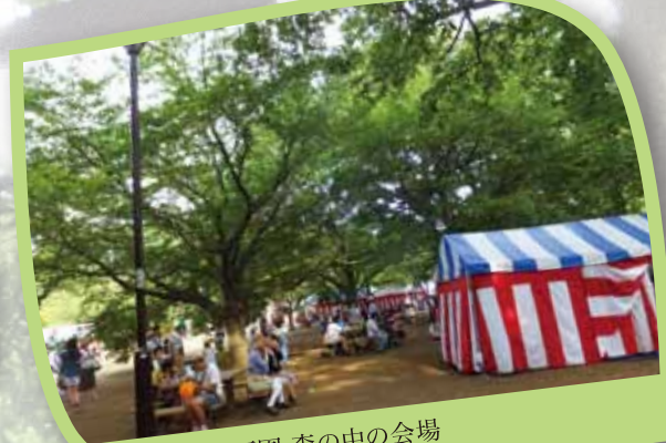
緑深い西園 森の中の会場