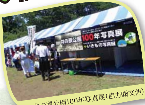
井の頭公園100年写真展(協力(株)文伸)