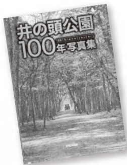
井の頭恩賜公園の歩みを 貴重な写真でたどる 『井の頭公園100年写真集』 （ぶんしん出版 2,800円+税）

今や「住みたい街ナンバーワン」として人気の吉祥寺と、海外にも名をはせる「三鷹ジブリ美術館」のある三鷹市。両市に広がる緑のオアシス「東京都立井の頭恩賜公園 おんし 」が、5月1日に開園100周年を迎えました。日本で初めてつくられた「郊外公園」としての歩みを貴重な写真でご紹介します（『井の頭公園100年写真集』（ぶんしん出版）より抜粋）。