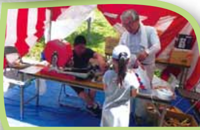
抽選会場 スタンプ7つ集めたら抽選できます