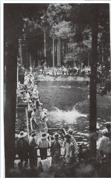
池尻につくられた天然プール

開園当初は東京市内の学校遠足地として人気となり、もって来園者を増やそうと大正10年に東京市で初めてのプールが作られました。井の頭池の池尻に作った天然プールです。現在もある池尻の茶店「泳遊亭」の名前にその名残が見られます。 大正12年に起きた関東大震災以降、被災者が武蔵野方面に移住を始め、近郊は急速に市街化しました。より魅力ある公園づくりのため昭和4年にボート場開設、昭和8年には25メートルの本格的なプールもでき、昭和9年には中之島に小動物園も開園されました。