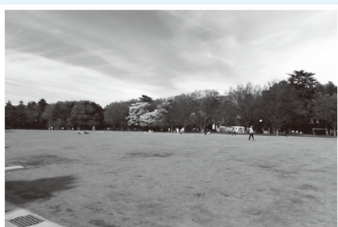
現在の西園。開園当初から少しずつ拡大してきた

井の頭公園は、開園当初の敷地から徐々に隣接地を買収して拡大してきました。日産厚生園の北部分、三角公園と呼ばれる井の頭公園駅の東側、小鳥の森と玉川上水の対岸にある第二公園、日産厚生園の南部分です。 その間、競技場や「三鷹の森ジブリ美術館」の開館や野球場も開設。明治時代の公園構想から始まり、大正、昭和、平成を経て、時代の多様なニーズに応えながら公園の進化は続いています。