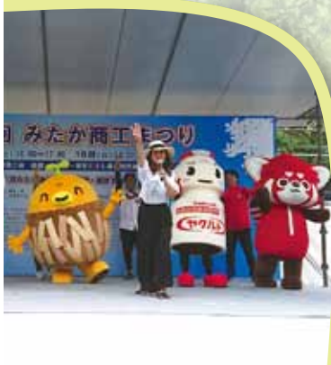
会場から「かわいい～」の声が