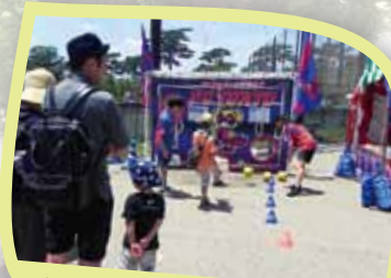
FC東京 ゴールをねえ!