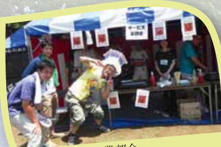
サービス業部会 「熱々フランクフルトだよ～」