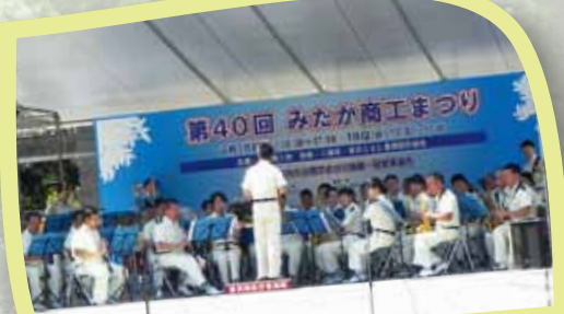
東京消防庁音楽隊の皆さんのステージ