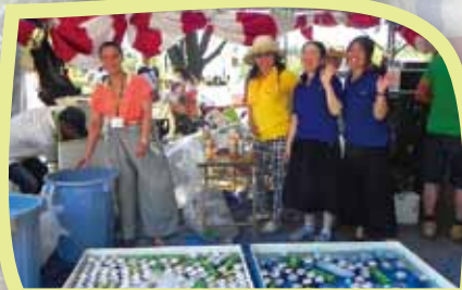
工業部会 「熱中症予防に、飲み物をどうぞ!」