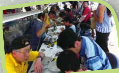
工業部会 ものづくり体験コーナー