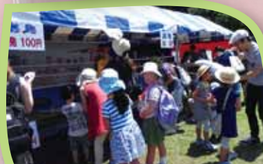
サービス業部会 射的は大人も子どもも真剣です