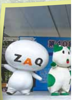
みののんと仲間が