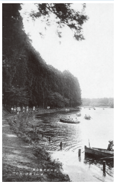
ボート場もできた