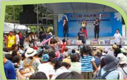
青年部 チャリティー大抽選会