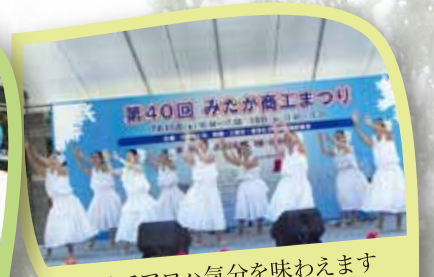
フラでアロハ気分を味わえます