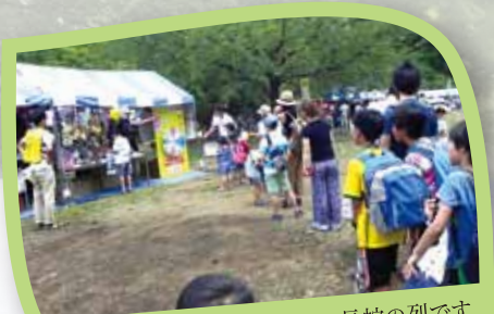
異業種交流プラザ ダーツに長蛇の列です