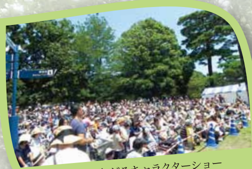
とにかく盛り上がるキャラクターショー