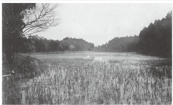
100年前の井の頭池。まだ橋はかかっていない

井の頭池周辺は太古の昔から人が居住していた遺跡が確認されており、江戸時代には井の頭弁財天を訪れる人々でにぎわいました。 100年前の池周辺は、うっそうとした杉林に囲まれていました。現在、井の頭自然文化園がある一角には、「東京市養育院感化部井之頭学校」がありました。校長は「日本資本主義の父」と呼ばれた渋沢栄一です。東京市には明治42年以来、井の頭地域を公園にする構想があり、渋沢校長は娘婿で東京市長の阪谷芳郎、東京市職員の井下清とともに公園づくりに尽力。今から100年前の大正6年(1917年)5月1日、日本初の「郊外公園」として開園されました。