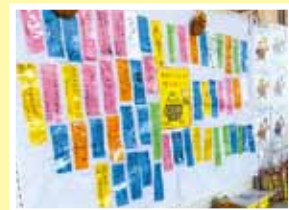
叶うといいね、お願い短冊