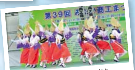
20周年! 三鷹商工連の阿波おどり