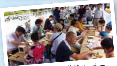
大人気のものづくり体験コーナー