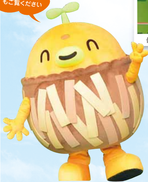
着ぐるみ「みののん」お披露目