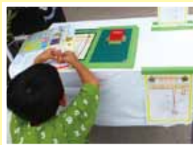
スタンプラリーにも並びました