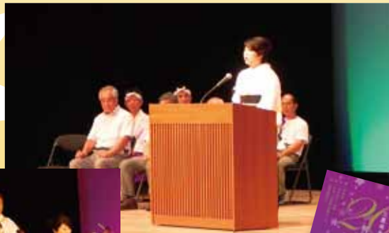
記念感謝祭の式典