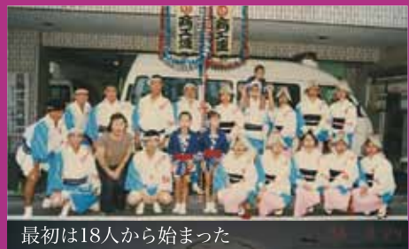
最初は18人から始まった

「魅せる連、夢中になる一体感、伝える『正調阿波踊り』で活気を地域に!」をモットーに、地元三鷹の活性化につながるよう、コツコツと練習を重ね連員一丸となって活動しています。 * (写真左上*)