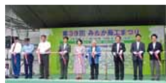
開会式のテープカット