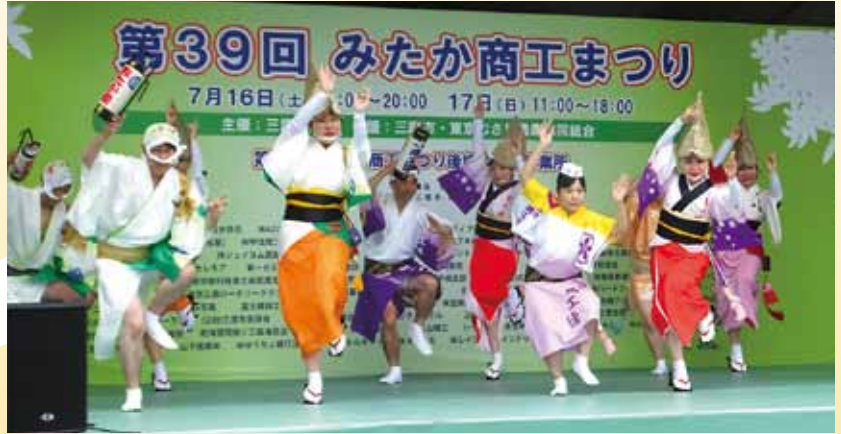
みたか商工まつりの特設ステージでも披露