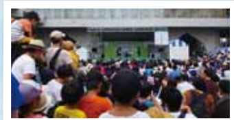
たくさんの人でにぎわう会場