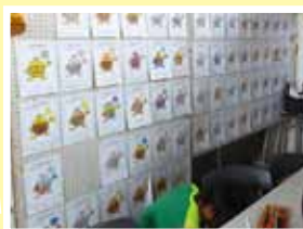
子どもたちが描いてくれたぬり絵