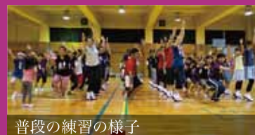
普段の練習の様子

【練習】 毎週水曜日 19:15~21:00 三鷹市内の体育館など 【問合わせ】 〒181-0013 三鷹市下連雀3-37-15 三鷹商工会館内 TEL:0422-49-3111 FAX:0422-49-3184 E-mail:mitakashokoren@gmail.com http://www.mitaka-shokoren.com