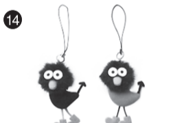
14 Poki携帯ストラップ (株)まちづくり三鷹