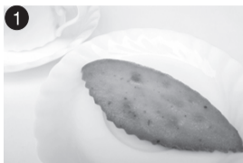
1 キウイフィナンシェ ハーベストオープン