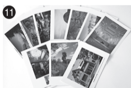
11 絵はがき 三鷹からのメッセージ (公財)三鷹市芸術文化振興財団