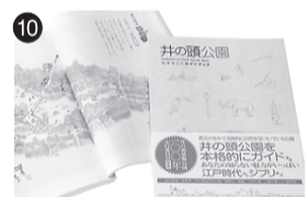
10 井の頭公園まるごとガイドブック (株)文伸/ぶんしん出版