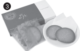
3 東京セブレ (有)そーほっと