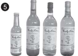
5 三鷹キウイワイン 武蔵野酒販協同組合