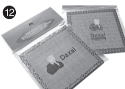
12 太宰治 コースター (有)関口十一畳店