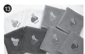
13 太宰治 刺繍タオルハンカチ NPO法人三鷹はなの会ワークセンターきょうどう