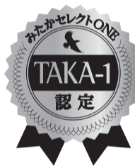
認定商品には「TAKA-1」認定シールを貼付しPRしていきます。

企画から募集、選考、審査、認定へと、苦労されたのはどんなことですか? 最終審査会は難航しましたね。約50品目の応募があり、商工まつりとインターネットでの投票結果も踏まえて、8月20日に認定商品を決めました。この最終審査会のときは予定時間を大幅に超えて約4時間かかりました。 10人の審査委員のポイント数を基準に、ポイント数だけでは計れない商品のプラスアルファ要素も考慮しました。たとえば、おみやげとして常時店舗に置けるのか、値段は適切か、品質保持期間や持ち帰り方法などの周辺整備も含めてです。 それから審査会で意外に苦戦したのが、