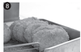
8 ムーちゃんコロッケ JA東京むさし三鷹地区青壮年部