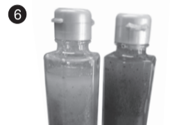
6 三鷹産野菜を使った旬菜ドレッシング (株)BE FREE