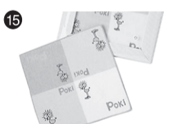
15 ポキのミニタオル (有)太田ふとん店

「TAKA-1」はどのような経緯で生まれたのですか? 三鷹の名物って何だろう?というのが始まりです。一昨年は三鷹市政60年、三鷹商工会も50周年を迎え、来年は国体会場にもなる三鷹市をもっとアピールしたい、そのために「三鷹らしい何か」「三鷹ブランド」を市民が一緒になって育て上げていこうという発想です。 今までもお店や企業単体での名物やお土産はありましたが、それらを連携しようという事業に、三鷹市をはじめ様々な団体が賛同、協力しました。 「TAKA-1」というネーミングは印象的ですね? 自動車レースのF-1や漫才コンテストのM-1などは馴染みがありますが、「TAKA-1」って何? と聞かれて説明することもありません。 「みたかセレクトONE」つまり三鷹の選ばれた「一品と逸品」両方の意味を含んでいます。