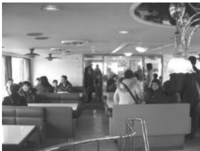
クルーシングを楽しむ

2月21日に商工会恒例行事である「日帰りバスツアー」を実施いたしました。 総勢178名の方に参加をいただいた。バスは一路駿河路へ……。静岡県清水のすし横町やクルーシング、そして最後は実ったばかりのおいしい苺を掴み取りいただきました。お腹がいっぱいのツアーでした。