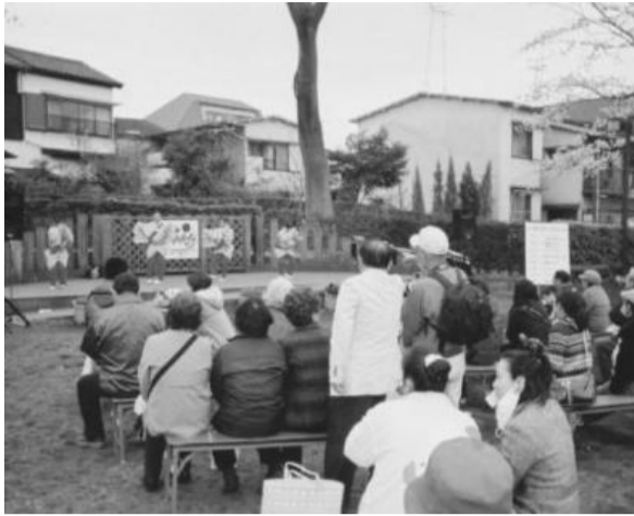
さくらまつりのステージ

にぎやかに開催された さくらまつり 4月4日に三鷹市の農業公園で「さくらまつり」が開催されました。当日は肌寒いを通り越して冬のような寒さでしたが、満開の桜の中、多くの方が集まりました。中央のステージでの催し物や各商店会が出店する暖かい食べ物などを楽しんでもらうなど、市民との交流が深められた一日でした。(委員・出田)