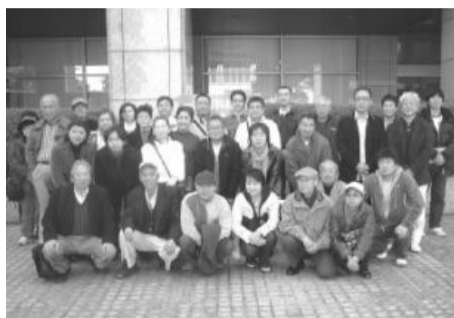
視察先での記念撮影

建設業部会では、3月14日(日)に31名の参加者で日帰り視察研修を実施いたしました。視察先は横浜の三菱みなとみらい技術館。宇宙、海洋、交通・輸送、くらしの発見、環境・エネルギー、技術探検の6つのゾーンに分かれており最先端の技術に触れることができました。研修終了後は大江戸温泉で懇親を深めました。